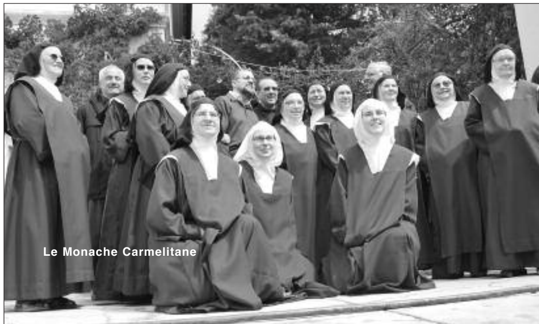
Le Monache Carmelitane

fre un'ulteriore testimonianza della sua vita di fede e di preghiera: “Comincio nel nome del Signore, con l'aiuto della sua gloriosa Madre, di cui porto l'abito e con quello del mio glorioso padre e signore S. Giuseppe, dalla cui intercessione sono sempre stata sostenuta. Sia lodato iddio!” (Prologo, 5).