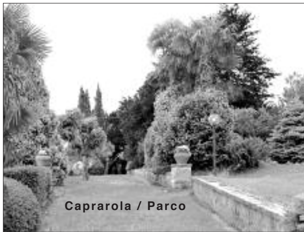
Caprarola / Parco

Come previsto dall'art. 43 del nostro Statuto, il Congresso dopo le elezioni, si è riunito in assemblea per esaminare la situazione dell'OCDS nel nostro territorio ed offrire a tutti l'opportunità di fare interventi propositivi, anche in vista di un valido contributo da