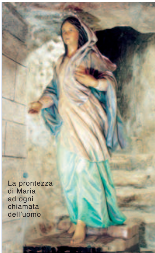
La prontezza di Maria ad ogni chiamata dell'uomo

Forse sentendo parlare di poesia si potrebbe diffidare di un serio contenuto di pensiero. Invece quella poesia è una profonda meditazione evangelica, nella quale volutamente Teresa, nel mese di maggio del 1897, volle esprimere tutto ciò che lei sentiva e pensava della Madonna. Era come un testamento spirituale. Avremo il modo di renderci conto della ricchezza dottrinale di Teresa. Possiamo fare un altro raffronto tra la piccola via dell'infanzia spirituale e il pensiero mariano di Teresa. ella via dell'infanzia Teresa ci ha dato una sua esperienza e una sua teologia di Dio nello splendore dell'Amore Misericordioso. L'insegnamento Teresiano ha avuto una risonanza immensa nella spiritualità della Chiesa. Oggi è sentimento comune, è la pietà di tutti. Il Signore si è fatto tanto vicino, amico, paterno, ricco di tenerezza. In una parola, la spiritualità