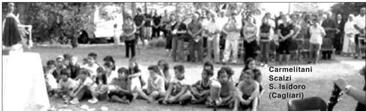
Carmelitani Scalzi S. Isidoro (Cagliari)

- “ Il Capitolo ricorda che il cammino di comunione verso un’autentica fraternità dovrà realizzarsi prevalentemente all’interno delle singole comunità (ma anche tra comunità), utilizzando come principale strumento la riunione comunitaria, che dovrà essere tenuta almeno una volta al mese. ” La qualità di vita delle nostre comunità è il cuore pulsante del Commissariato. I superiori sono i responsabili ed i primi artefici di questo cammino, anche se