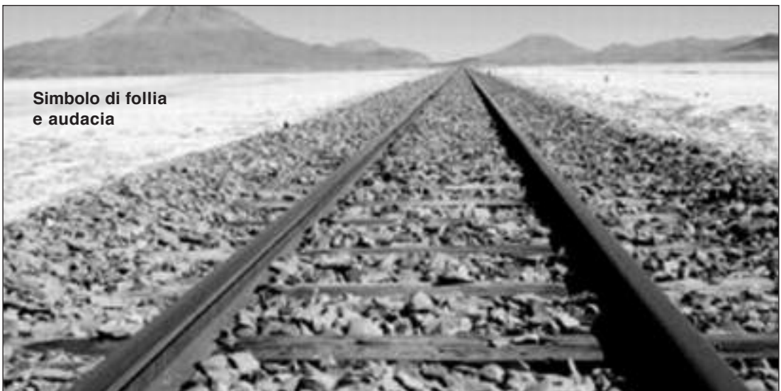
Simbolo di follia e audacia

Essere piccoli vuol dire riconoscere il proprio nulla, attendere tutto dal buon Dio come un bambino attende tutto da suo padre e non inquietarsi di nulla, non accumulare tesori..... Essere piccoli vuol dire non attribuire a se stessi le virtù che si