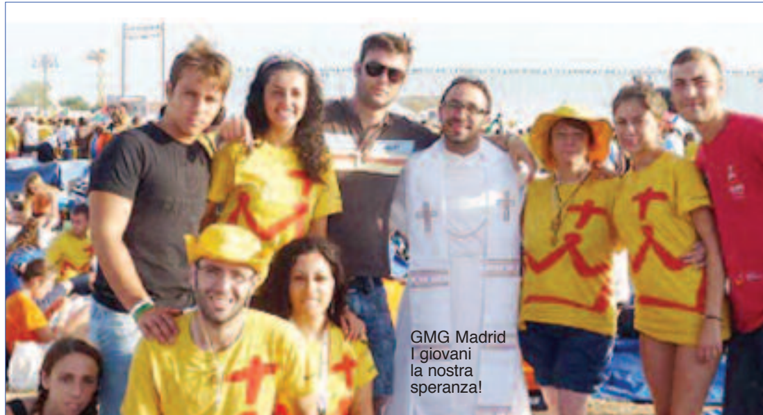
GMG Madrid I giovani la nostra speranza!

saria e incontenibile di una vita fraterna carmelitana, ogni impegno pastorale dovrebbe rivelare al mondo l'icona, il volto della comunità che invia. Viceversa, colgo il rischio che l'impegno ministeriale divenga luogo di auto-affermazione, magari in spirito difforme rispetto alla comunità. Debbo notare che, se questo è il "volto pubblico" delle nostre presenze locali, al grande ed infaticabile lavoro dei nostri religiosi difficilmente corrisponderanno frutti di comunione (e di conseguenza penso, anche vocazioni). L'espressione pur brillante del carisma di un religioso non produce frutti condivisi se è separato, corpo e anima, dalla famiglia di appartenenza. In un certo senso, facendo appello a tutti i religiosi del commissariato, si domanda di "lavorare doppio", con molta generosità, senza riserve; ma è necessario che ciò avvenga soprattutto al livello locale, economizzando sull'eccesso di mobilità, ostentando nelle proprie attività pastorali il volto del Cristo, ovvero la presenza viva della fraternità carmelitana di appartenenza, la comunità che invia.