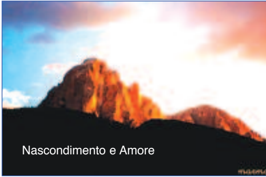
Nascondimento e Amore

bianco, che non si nasconde ed ha radici molto profonde.”