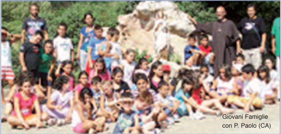
Giovani Famiglie con P. Paolo (CA)

da una bruma spessa, mai ho contemplato l'aspetto ridente della natura inondata, trasfigurata dallo splendore del sole; fin dall'infanzia, è vero, ho inteso parlare di queste meraviglie, so che il paese nel quale sono nata non è la mia patria, che ce n'è un'altra alla quale debbo aspirare incessantemente».