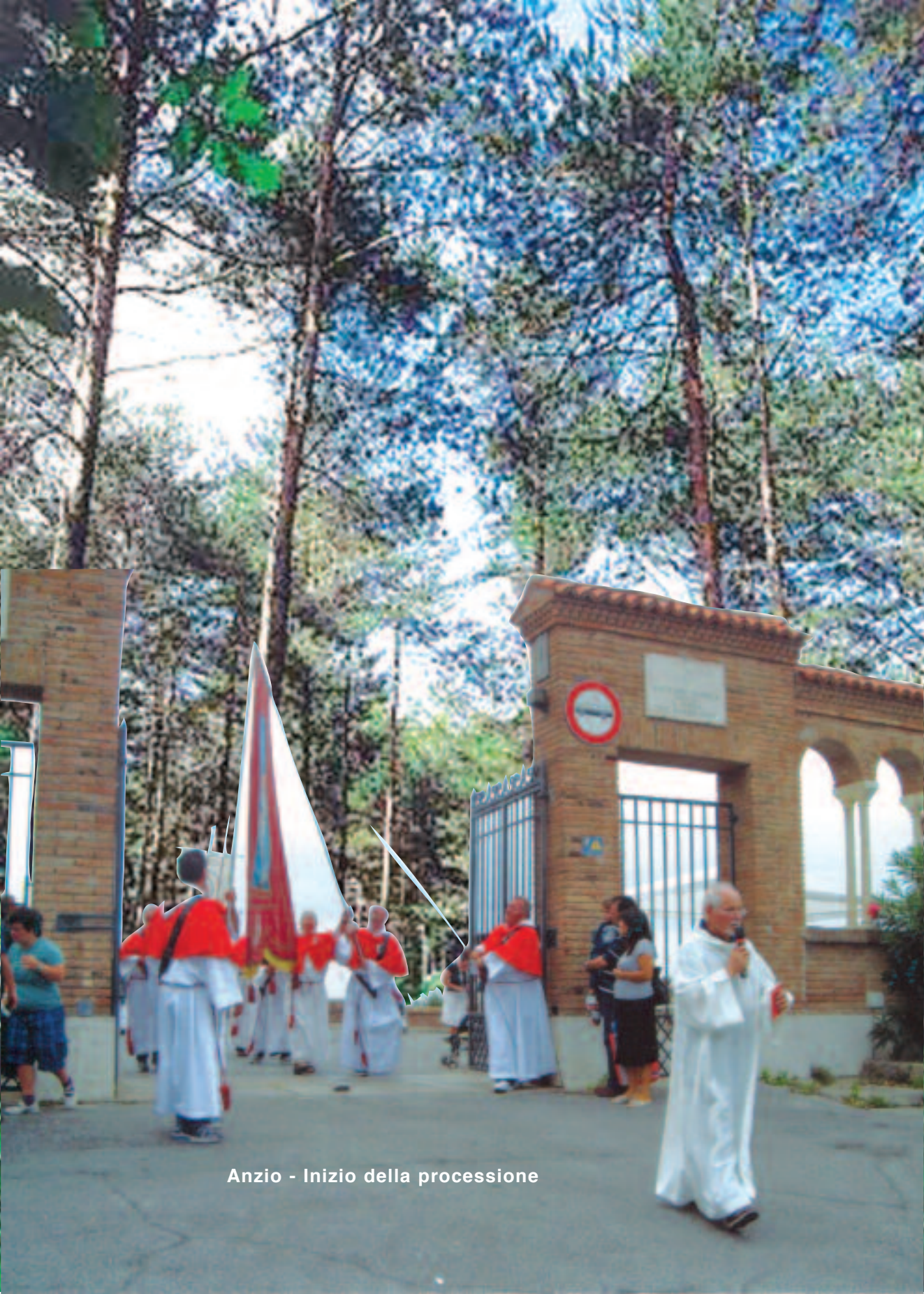
Anzio - Inizio della processione