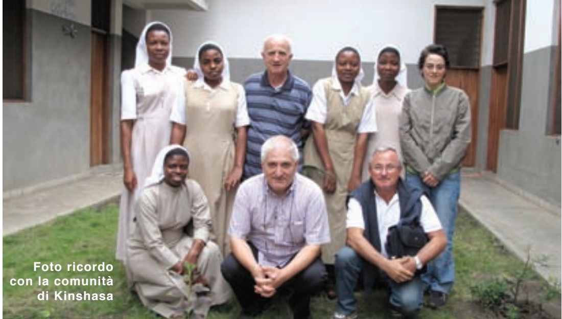
Foto ricordo con la comunità di Kinshasa

iani, do il benvenuto e voglio dire grazie per tutto ciò che è stato fatto per me durante il corso dei miei studi, dalle elementari agli studi umanitari.