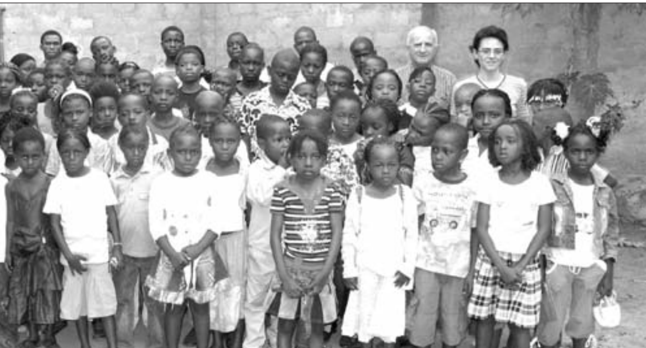
Gruppo Adottati a distanza di Kinshasa